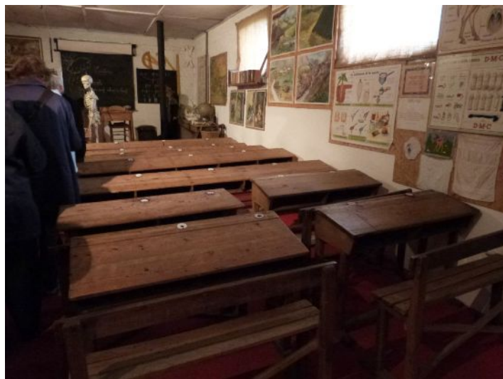
Reconstitution d'une classe au début du XX ème siècle