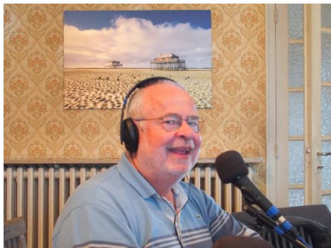
'Les passeurs de Mémoire'