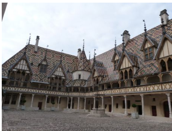
Cour de l'Hôtel-Dieu

L'Hôtel-Dieu , hôpital pour les Pôvres a été fondé en 1443 par Nicolas Rolin, chancelier du duc de Bourgogne et son épouse Guigone de Salins. Cette magnifique construction a été édifiée avec les plus nobles matériaux qui lui ont garanti sa pérennité durant des siècles. Charité et soins y ont été prodigués jusqu'en 1971. Des donations importantes ont été faites au fil du temps et constituent un domaine viticole où ont lieu chaque année la célèbre Vente des Vins. Cette vente permet aux Hospices de Beaune de financer les investissements de leur modernisation hospitalière et l'entretien du patrimoine.