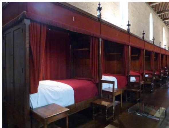
Salle des Pôvres

Il est évident que, passant en Bourgogne, nous nous devons de faire une dégustation dans une cave.